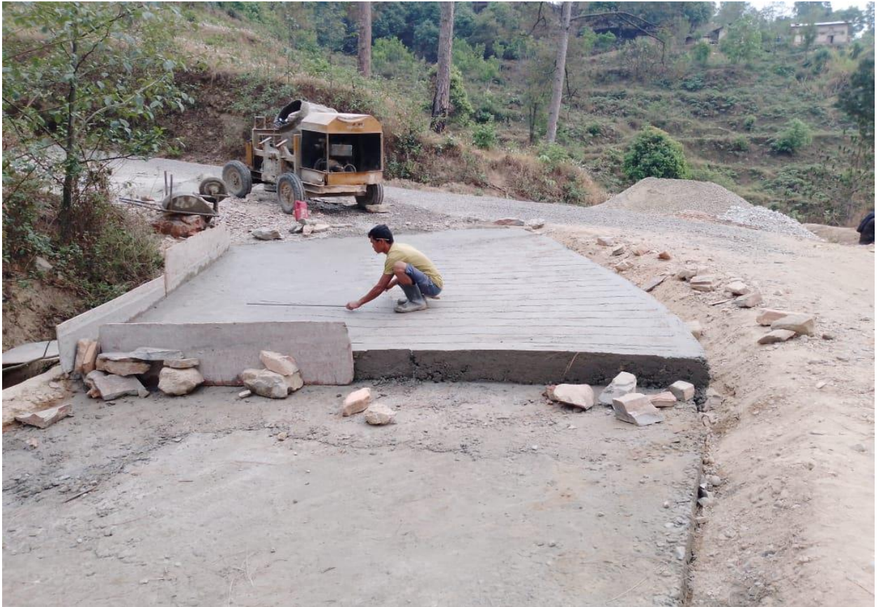
बगरकोट रुपाल सडक खण्ड पूर्वाधार विकास कार्यालय, डडेल्धुरा ।