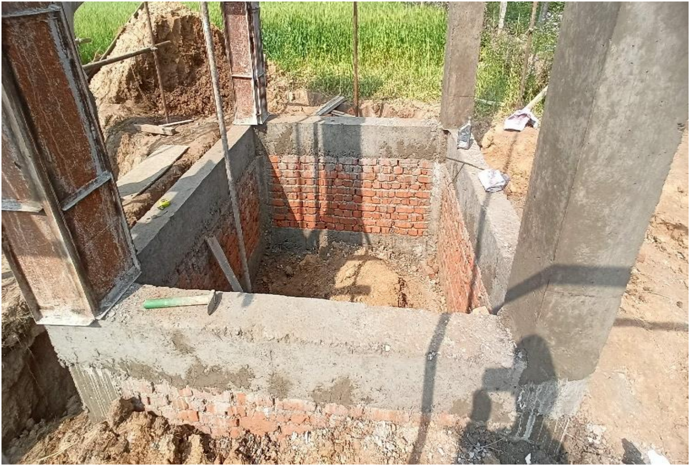
Hariyali DTW, Dhangadhi-19, Kailali भूमिगत जलस्रोत तथा सिंचाइ विकास डिभिजन कार्यालय, कैलाली ।