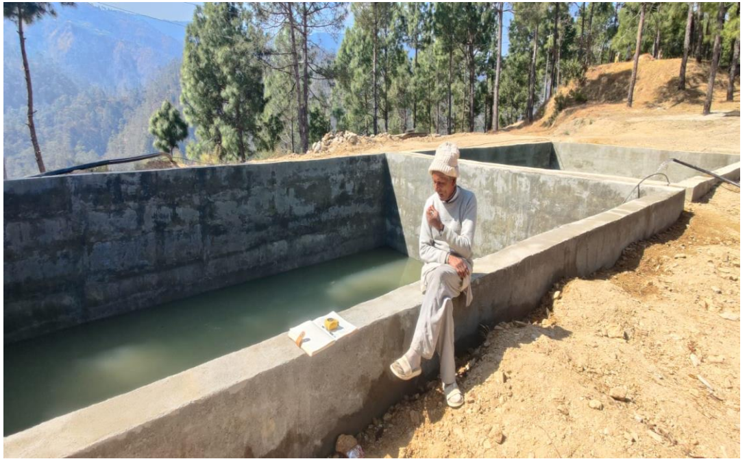
Gagarkot Isp bhageshwar-4