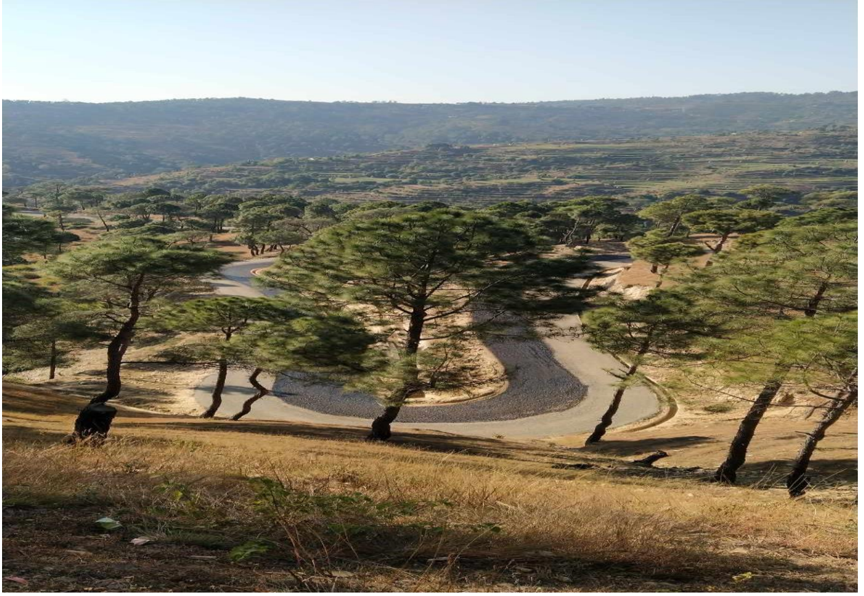
उग्रतारा मेलौली सडक, डडेल्धुरा ।