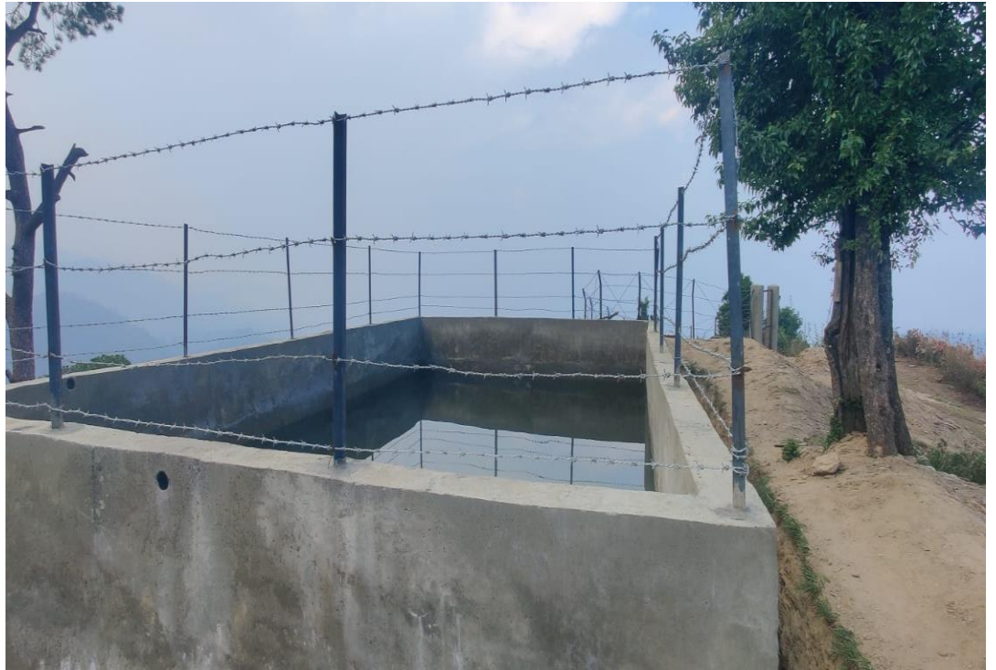
Thadlek Isp Parsuram-2