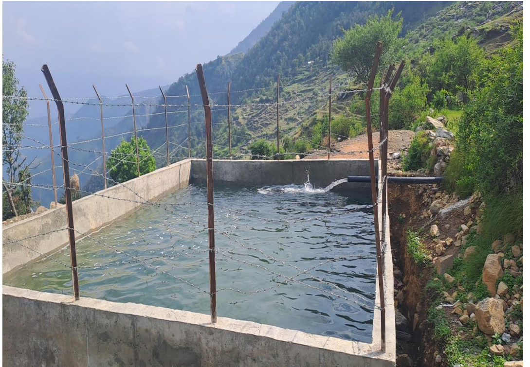
मझखोरी सिचाई पोखरी छबिस पथिभेरा -६