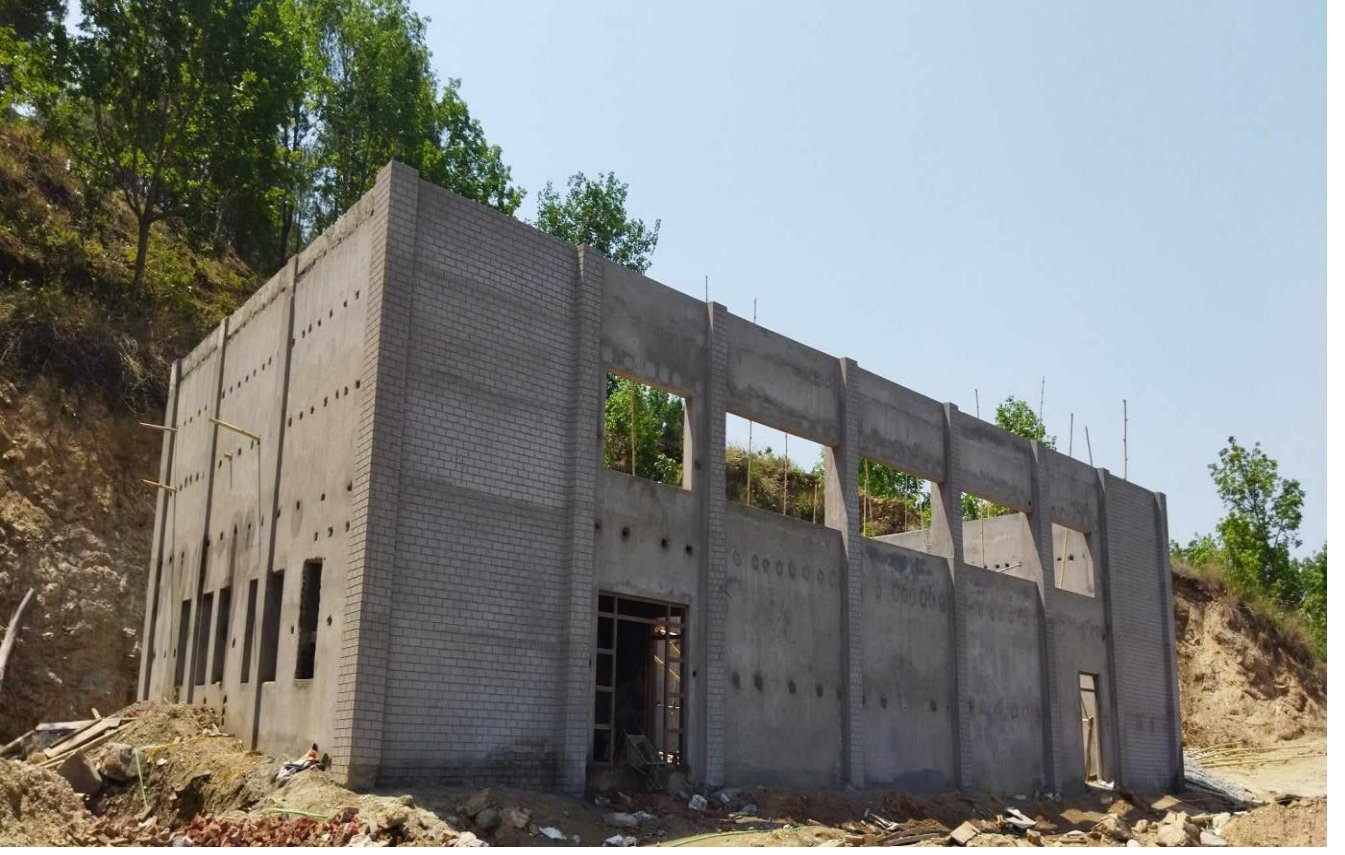
निर्माणाधिन वयलपाटा कर्भड हल निर्माण सा.न.पा-०८, अछाम