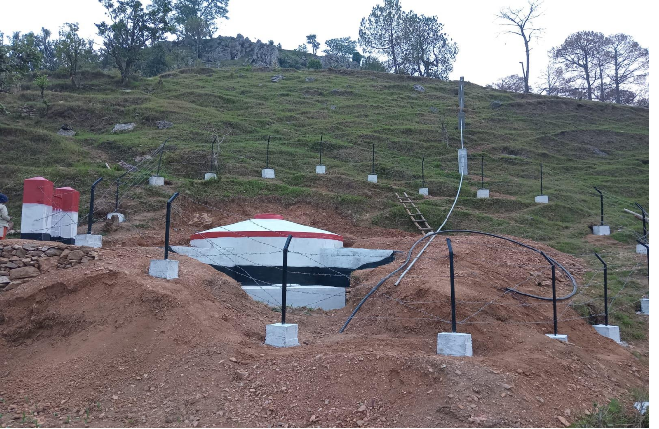
जरोली बिराली खा पा १, बैतडी खानेपानी तथा सरसफाई डिभिजन कार्यालय, बैतडी ।