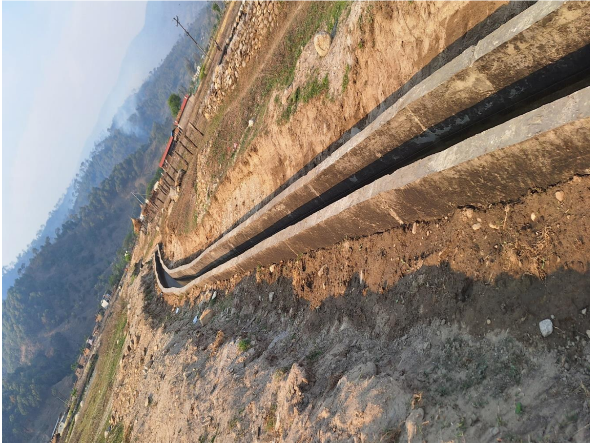
लस्कर सिंचाइ योजना, जोरायल ३ डोटी