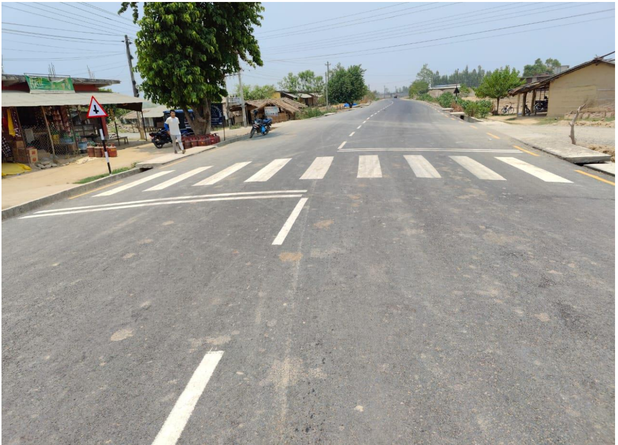
सुखखड भजनी सडक कालोपत्रे, घोडाघोडी नगरपालिका, कैलाली (Double lane, First Asphalt Road of IDO, Kailali ७.८७ KM) पूर्वाधार विकास कार्यालय, धनगढी, कैलाली ।