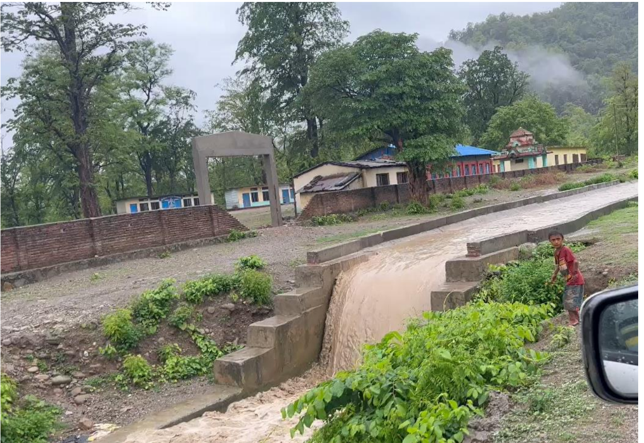
पथरैया मोहना सिंचाई व्यवस्थापन कार्यालय, कैलाली ।