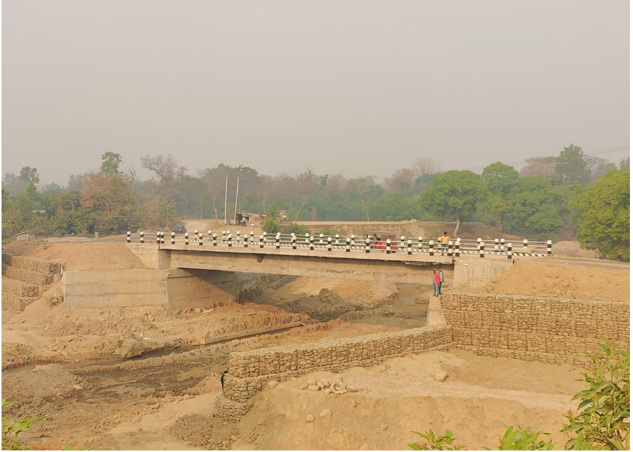
बौराहा नादिमा पकी पूल निर्माण चित्तलपुर घो.न.पा.२ (RCC 25m span Double Lane with Footpath)