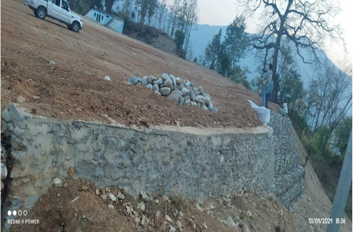
बडासैन खेल निर्माण, अछाम शहरी विकास तथा भवन कार्यालय, डोटी ।