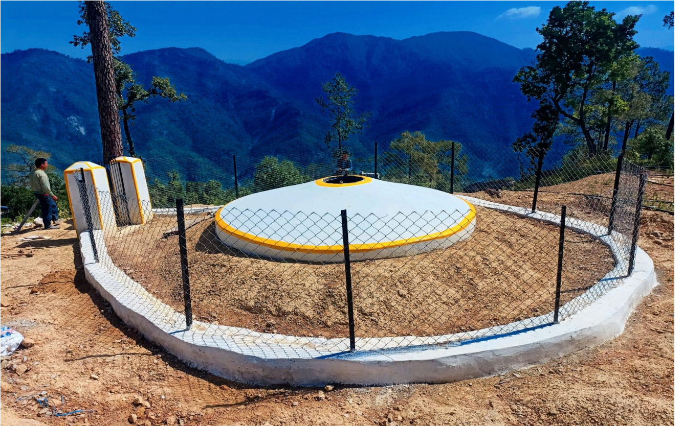
१४ घ.मी. फेरो सिमेन्ट टंकी घरखेडा खा.पा.यो. चुरे गा.पा., कैलाली