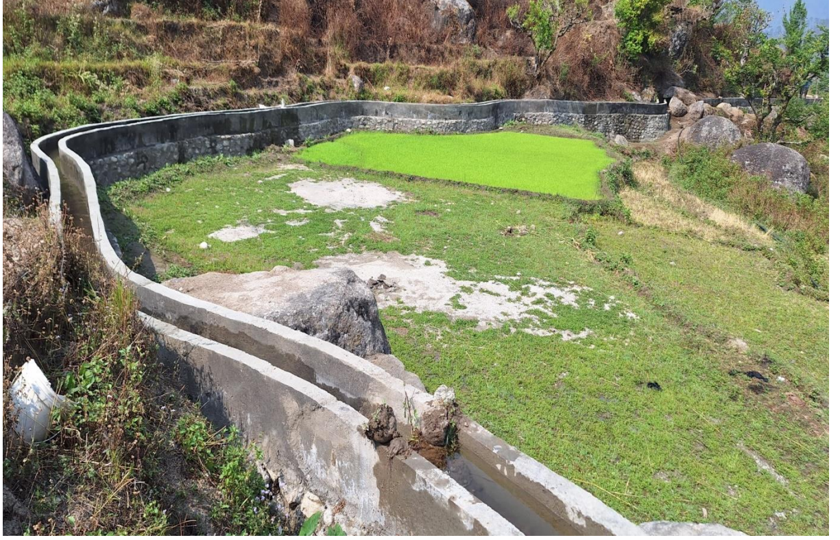
जलस्रोत तथा सिंचाइ विकास डिभिजन, डोटी।