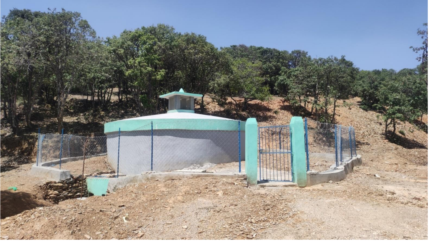
गौरली खा.पा.आ. १०० m ३ टंकी खानेपानी तथा सरसफाई डिभिजन कार्यालय, डोटी ।