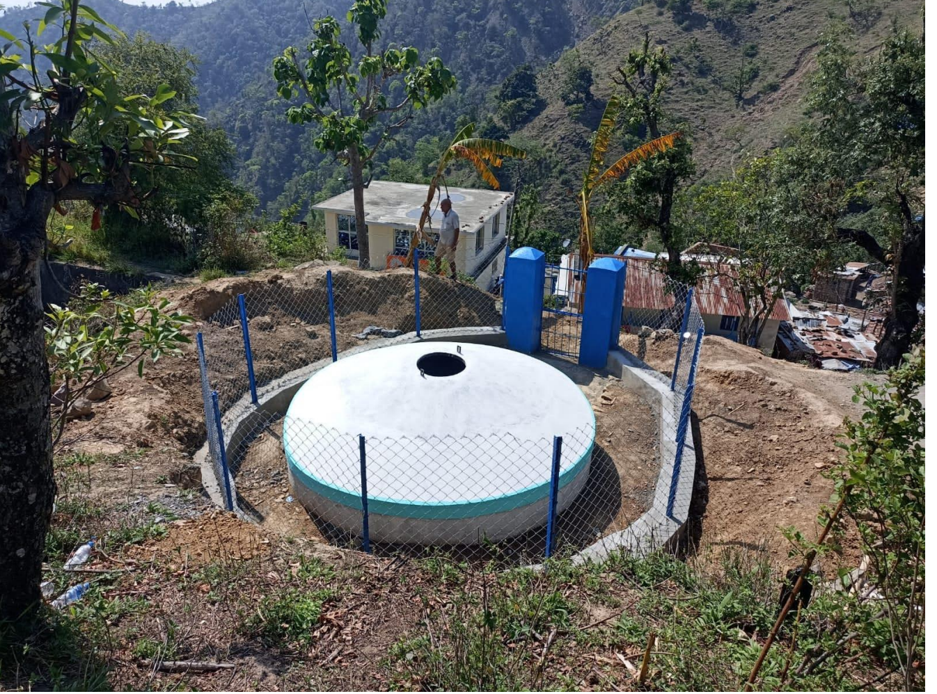
१४ घ.मी. फेरो सिमेन्ट टंकी मारभट्टी खा.पा.यो. चुरे गा.पा., कैलाली