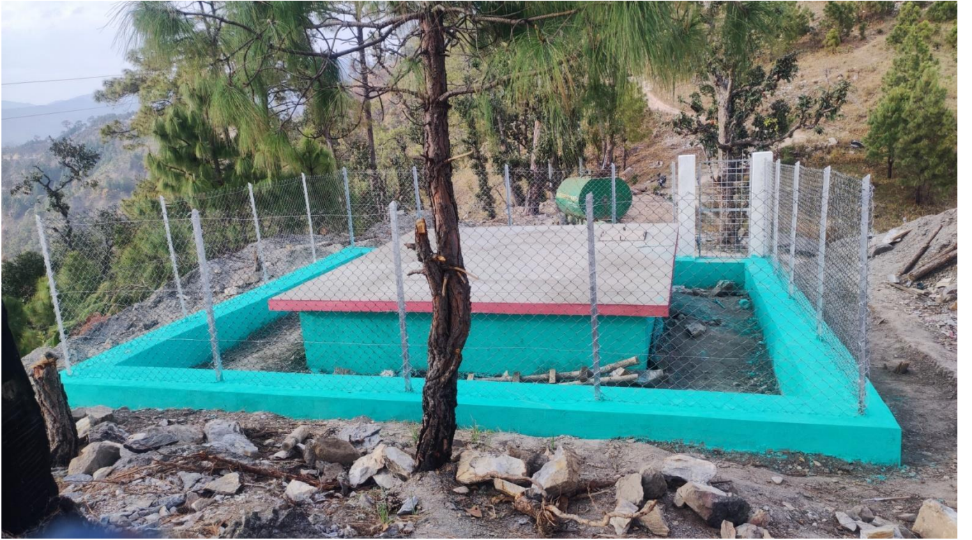
बाजीलेख खा.पा.यो खानेपानी तथा सरसफाई डिभिजन कार्यालय, डोटी ।