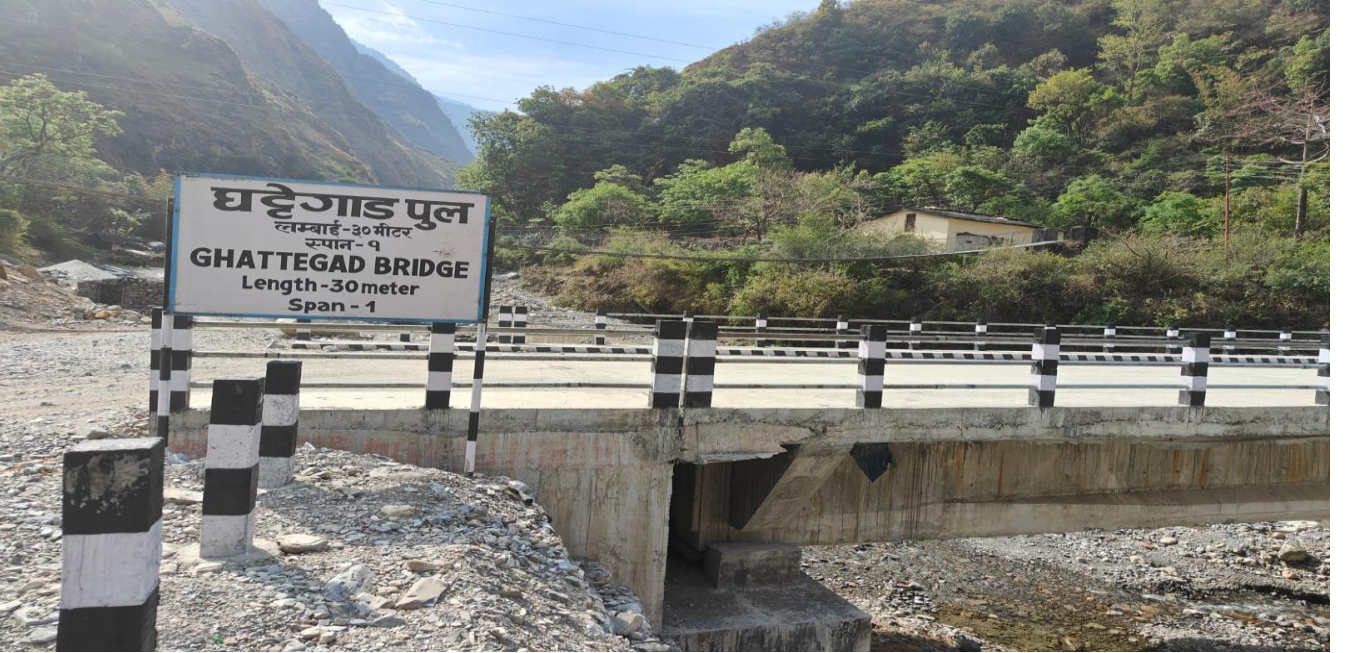
घट्टेगाड सडकपुल-३० मि,मर्मा गा.पा दार्चुला पूर्वाधार विकास कार्यालय, बैतडी ।