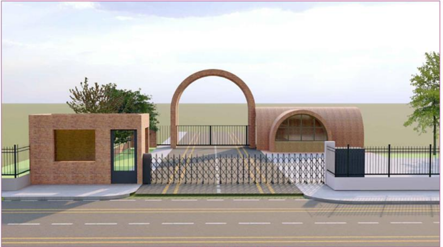
ENTRY GATE TO LMP GATE OPTION 3